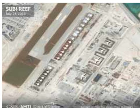
Một không đoàn chiến đấu cơ trên đảo.