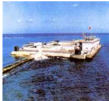
a) Bệnh Viện; b) Platform (96mX116m) dàn phóng hoá tiễn bắn hạ vệ tinh của Mỹ, khiến cho HKMK Mỹ bất khiển dụng