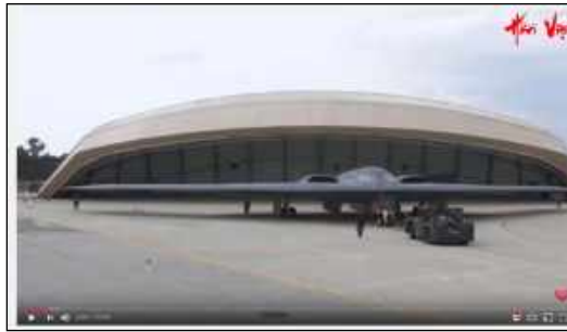
a) các kiến trúc trên đảo; b) máy bay tiềm kích và hangar